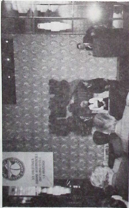
Prigodni govor druga Grila, republičkog sekretara za pomorstvo, saobraćaj i veze