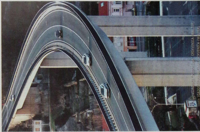
IZDAVAČKI DRUŠTVO CESTE, CRKVIENKA (WALTER) www.via-vita.hr