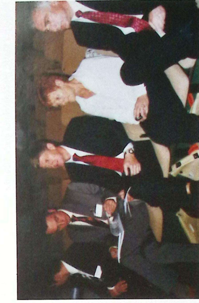
Pokrovitelji i domaćini Savjetovanja u Sularisu

Što se tiče poslovanja, pa i efikasnosti, rekli su nam da smo daleko odmakli, da je cestovni sektor u nas najbolje organiziran. No, to nas ne mora zadovoljavati, treba napraviti dodatne napore tako da u tome pravcu idemo još dalje što potvrđuje i ovo savjetovanje, što više, smatram da je ovo samo prvo savjetovanje u ciklusu, koji treba